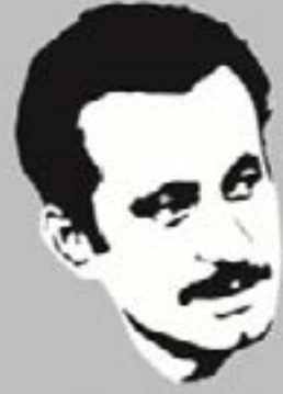
أسماها الأديب الشهيد غسان كتفالي عام 1969